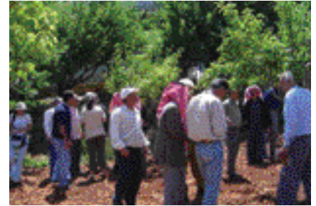
Durant l'atelier de formation sur l'agriculture biologique

Institut de Recherches Agricole Libanais Tel Amara Station, Bekaa—Lebanon P.O. Box: 287, Zahlé