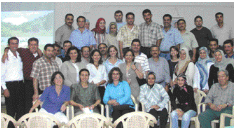
Durant la session de formation pour les enseignants des écoles locales

Durant le mois de Juillet, le Projet de l'Agrobiodiversité a organisé, en collaboration avec le Ministère de l'Environnement, plusieurs sessions de formation adressées aux enseignants provenant des différents sites du projet. Une moyenne de 27 professeurs a assisté à ces sessions de formation traitant les sujets suivants: