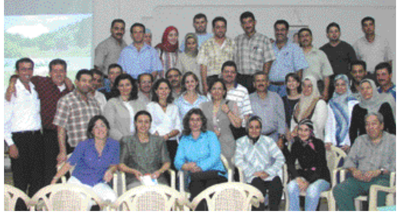
خلال الدورة التدريبية للمعلمين

أقام مشروع التنوع الحيوي الزراعي في لبنان خلال شهر تموز عدة دورات تدريبية للمعلمين بالتعاون مع وزارة البيئة حضرها حوالي ٢٧ معلماً. وقد تضمنت هذه الدورات المواضيع التالية: مشاكل البيئة وطنياً وعالمياً، النظم البيئية، التنوع الحيوي في لبنان، التنوع الحيوي الزراعي، إنشاء النوادي البيئية في المدارس وإقامة أنشطة لاصفية، التربية البيئية وطرق التعليم.