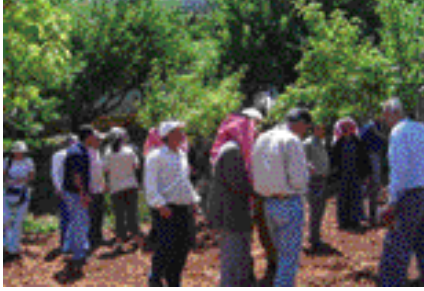
ورشة عمل حول الزراعة العضوية

أقام المشروع، بالتعاون مع الجامعة الأميركية في بيروت ووزارة الزراعة، ورشة عمل حول الزراعات العضوية للمزارعين في مناطق عمل المشروع (عرسال، نبحا، حام ومعربون). حضر الورشة ١٧ مزارعاً مهتماً بهذا الموضوع وقد تضمنت زيارة ميدانية لمزرعتين في منطقتي "شليفا" و"مزرعة السيد" حاصلتين على شهادة في الزراعة العضوية. وقد تم التعرف على الوسائل المتبعة والسبيل للحصول على شهادات للزراعة العضوية معترف بها دولياً.